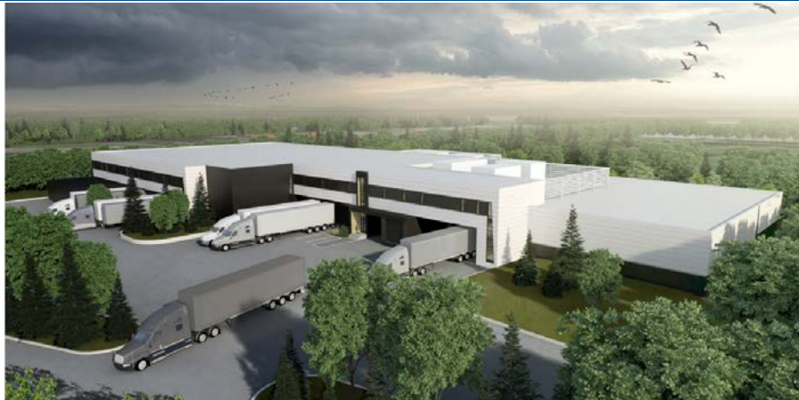
Solution immobilière projetée – Plateforme clinico-logistique

Intégrée au projet du nouveau complexe hospitalier (NCH), la plateforme clinico-logistique (PCL) est un concept innovant, à la fine pointe de la technologie, permettant de regrouper plusieurs fonctions logistiques hospitalières du CHU de Québec-Université Laval (CHU) sur un site externe. La PCL constitue une opportunité unique pour le NCH de contribuer aux missions du CHU en innovant en ce qui a trait à la logistique hospitalière et en inspirant une vision d'avenir.