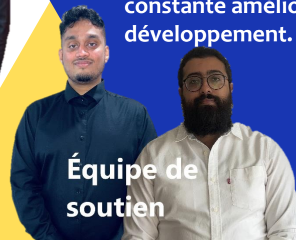
Équipe de soutien