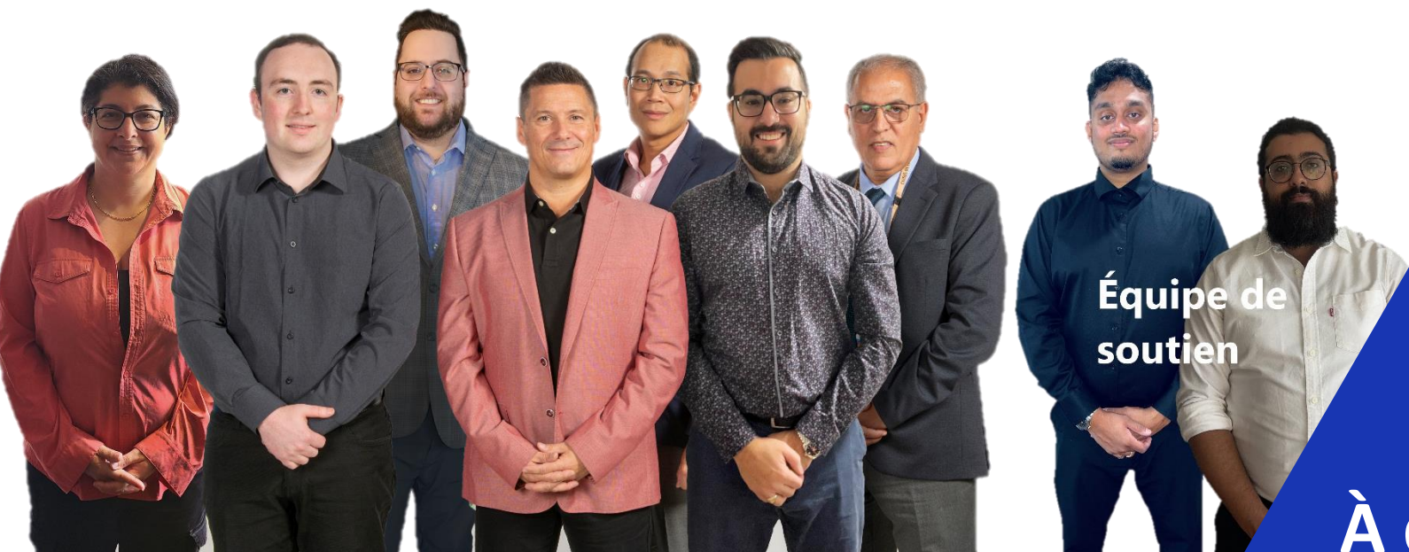
Équipe de soutien