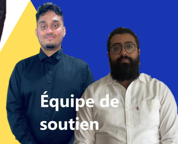
Équipe de soutien

Après un an d'utilisation, quel message adresseriez-vous aux collègues des établissements ne disposant pas du CIO?