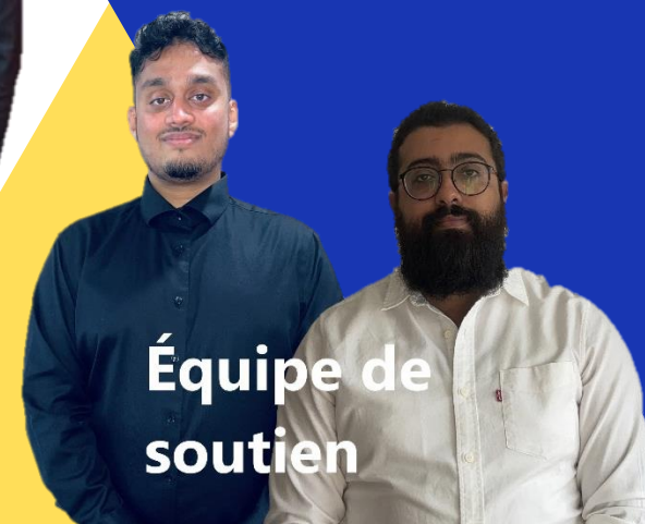
Équipe de soutien