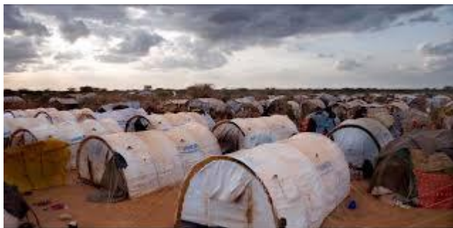
Ailleurs dans le monde