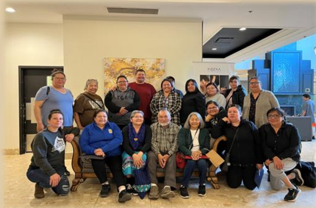
Appréciation de nos proches aidants cris.

Visite communautaire : une journée d'information et de rencontre.